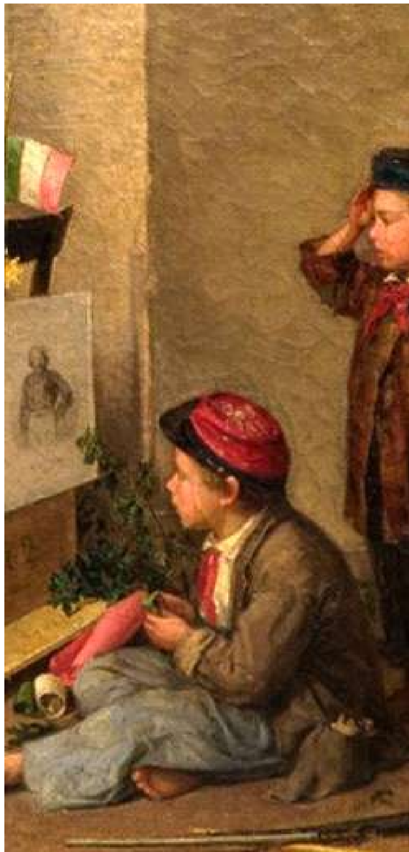
Nell'immagine il particolare di un'opera di Gioacchino Toma (1836- 1891)

dialogano con l'autrice (Università di Salerno)